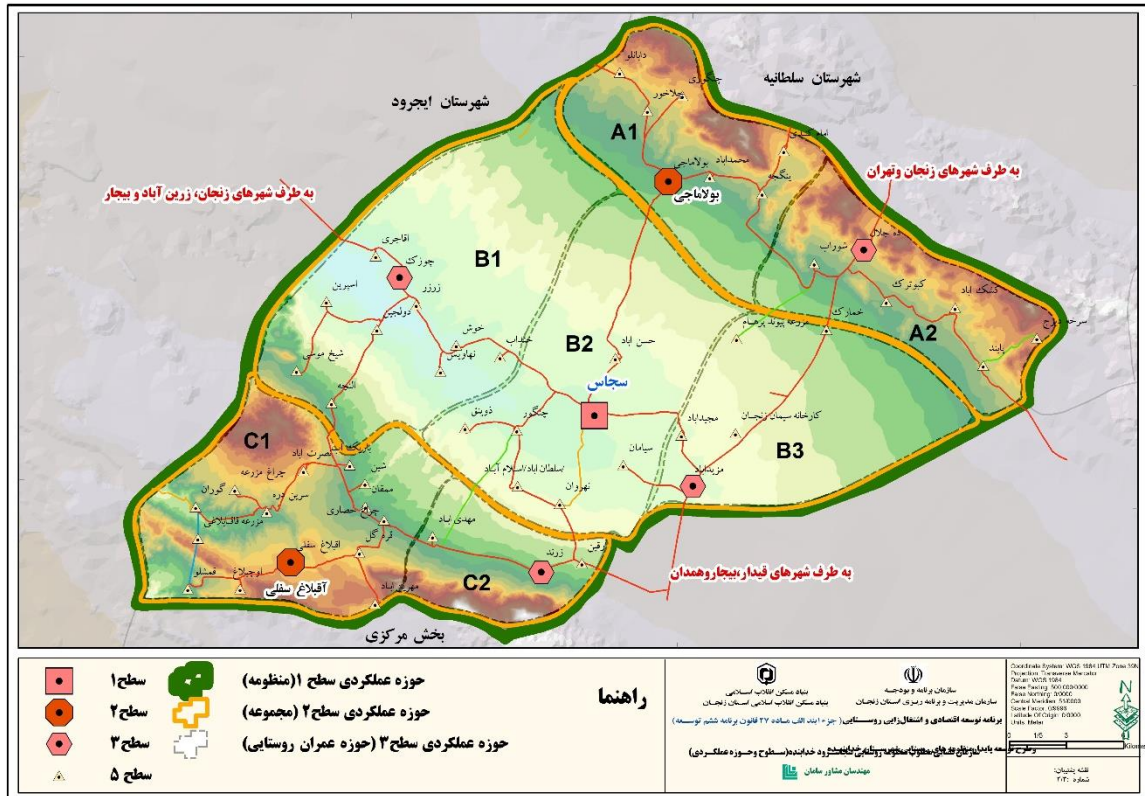
نقشه ۴: اولویت و گرایش ماموریت های محوری اقتصادی حوزه‌های همگن فضایی