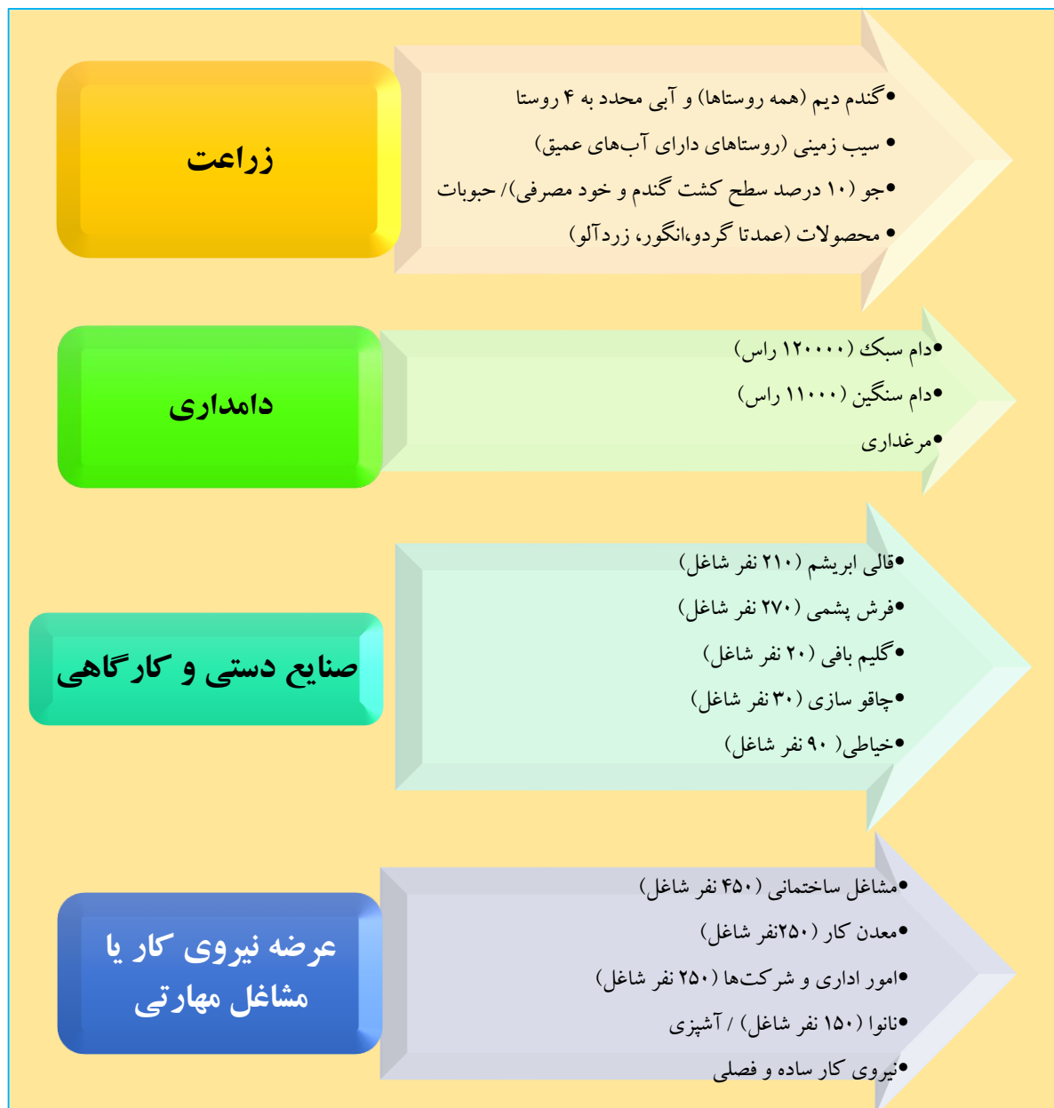
شکل ۱: منابع اصلی درآمدی منظومه سjasرود

ساختار اقتصادی منظومه روستایی سjasرود به ترتیب بر محورهای کشاورزی (زراعت دیم و آبی و دامداری)، عرضه نیروی کار به روستاها و مناطق دیگر و مشاغل مهارتی و واحدهای کارگاهی شکل گرفته است.